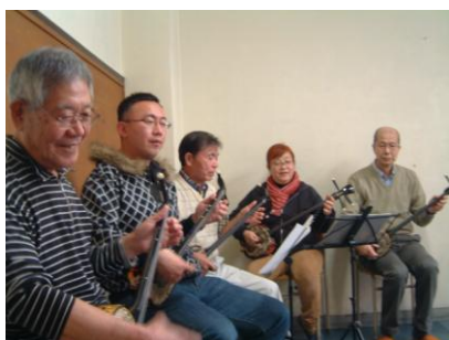
二胡教室とロシア民謡講座と三線教室

4番目は三線教室です。琉舞のゆうなの会の応援もいただいて、華やかな演奏と踊りが繰り広げられました。即興の歌に大笑い、最後はカチャーシーになって、会場の人たちも踊りました。右下のピンぼけ写真は乱舞の光景とご理解ください。